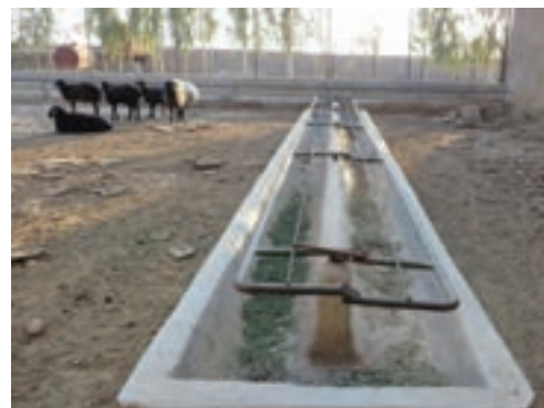
آخور دو طرفه