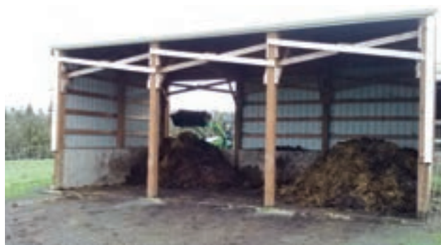
انبار نگهداری و ذخیره کود