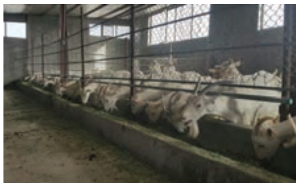
آخور یک طرفه