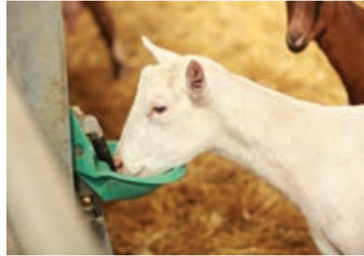
آبشخور خودکار مخصوص گوسفند و بز

جدول ۲- ابعاد توصیه‌شده آبشخور به ازای هر رأس گوسفند و بز در سنین مختلف (سانتی‌متر)