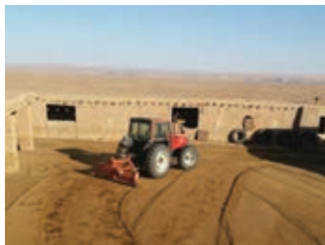
جمع آوری کود با تراکتور