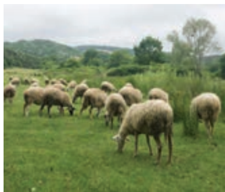
تغذیه از چراگاه

روش های تغذیه را می توان به انواع تغذیه از چراگاه و تغذیه دستی تقسیم بندی کرد.