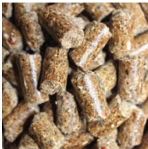
نمونه‌ای از جیره پلت

به طور کلی با توجه به نژاد، جنس، وزن، وضعیت دام و مانند آن سه نوع جیره غذایی وجود دارد: 1 جیره نگهداری: جیره‌ای است که دام با مصرف آن هیچ نوع تولید و افزایش یا کاهش وزنی نخواهد داشت و شرایط دام را از نظر سرزندگی، سلامت و وضعیت طبیعی حفظ می‌کند. جیره مذکور در حقیقت حداقل نیاز یک حیوان است.