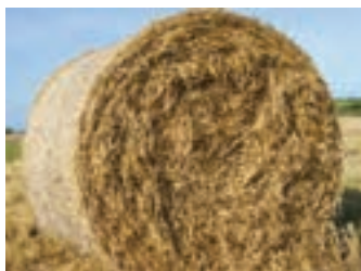
کاه و کلش حاصل از غلات