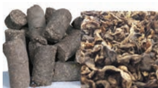
تفاله چغندر قند به صورت پرک و پلت

تفاله چغندر قند: حجیم، خوش خوراک و ارزان است که دارای مواد قندی زیاد بوده و حدود ۹/۶ درصد پروتئین و ۰/۵ درصد چربی است. از نظر کلسیم غنی و از لحاظ فسفر ضعیف می‌باشد. تفاله ممکن است به صورت خشک مصرف شود، اما اکثراً تفاله چغندر را با نسبت مناسب آب مخلوط می‌کنند تا مرطوب شود و بافت مناسبی پیدا کند و سپس در جیره دام وارد می‌کنند.