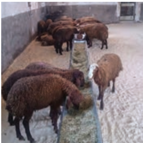
تغذیه یونجه و کاه در آخور

جیره غذایی مخلوطی از چند ماده خوراکی است که دارای مقدار و نسبت صحیحی از انرژی و مواد مغذی مختلف بوده و چنانچه روزانه و به میزان کافی در اختیار دام قرار گیرد، احتیاجات آن را از نظر انرژی، پروتئین، مواد معدنی و سایر مواد مغذی در این مدت تأمین می‌کند.